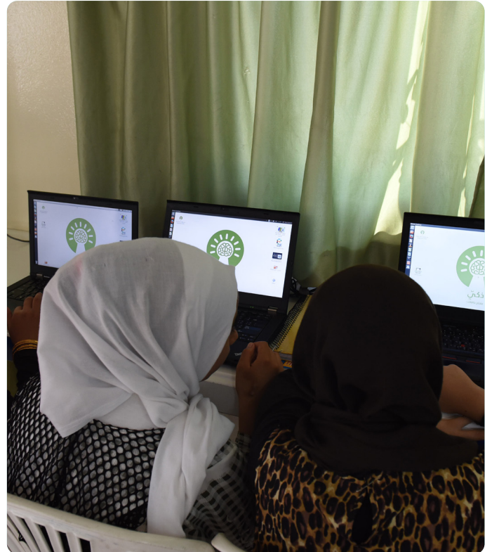
تتيح أجهزة الكمبيوتر المحمولة من 'ذكي' للطلاب إمكانية الوصول إلى مواد تعليمية بالإنجليزية والعربية والفرنسية.

وقد تم إطلاق مجموعة أدوات المعلم الرقمية رسمياً في أبريل عام 2022 وتمت تجربتها في ست بيئات تعليمية (خمسة في الأردن وواحدة في الإمارات العربية المتحدة).